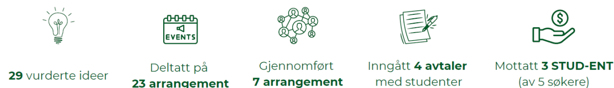
Figur 2: Oversikt over resultater og aktiviteter innen 'Unge gründere' i 2024.

Norinnova har over flere år satset på å utvikle flere unge gründere i Nord-Norge. Satsingen inkluderer studentinnovasjon (medfinansiert av Samfunnsløftet til Sparebank1 Nord-Norge) og har bidratt til å hjelpe studenter med å etablere nye bedrifter og blant annet hjelpe de med å finne finansiering. I 2024 har vi hatt høy aktivitet på området (se figur nedenfor). 29 innovative idéer fra studenter ble i 2024 evaluert og hele 3 av 5 søknader til den nasjonale Stud-ENT ordningen til Innovasjon Norge fikk innvilget stipend på 1 mill.kr hver.